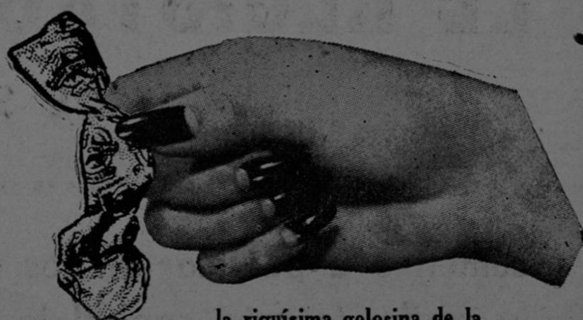
la riquísima golosina de la